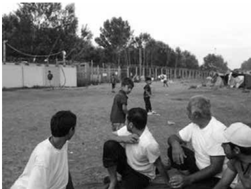
Horgos: migranti accampati nel campo informale in Serbia al confine con l'Ungheria

“Cosa rimaniamo a fare qui?”, è la domanda ricorrente che i migranti bloccati in Grecia si fanno. L'obiettivo infatti è quello di proseguire il viaggio verso nord, per raggiungere gli Stati europei con maggiori possibilità di inserimento sociale e lavorativo.