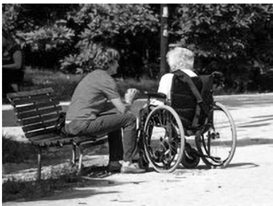
Badanti in Ticino

Per molte migranti i legami sociali extrafamiliari in patria sono rari o sono andati diradandosi nel corso del percorso migratorio. Alcune hanno mantenuto delle amicizie con persone all'estero, ad esempio in Italia dove quasi tutte hanno soggiornato per parecchi anni prima di arrivare in Ticino. Molte sono inoltre consapevoli dei giudizi negativi nei loro confronti da parte di connazionali rimasti nel paese d'origine poiché sono viste come coloro che sono partite per denaro lasciando i figli senza la presenza costante della figura materna. Le donne incontrate sottolineano come sia importante riuscire a costruire dei legami con altre persone nel contesto di vita attuale e creare delle forme di aggregazione e di solidarietà tra connazionali e autoctone per evitare il rischio della "doppia assenza" (Sayad 2002), ossia sentirsi isolate sia in patria sia nel paese d'approdo (ibidem, p. 100). Infine i gruppi formali ed informali costituitisi negli anni successivi la ricerca tramite attività sindacali e offerte formative per collaboratrici domestiche hanno mostrato le capacità organizzative e solidali di queste lavoratrici estereuropee ed espresso la loro agency (Sen, 1985; Castles, 2004) intesa come capacità di mobilitare risorse personali e collettive.