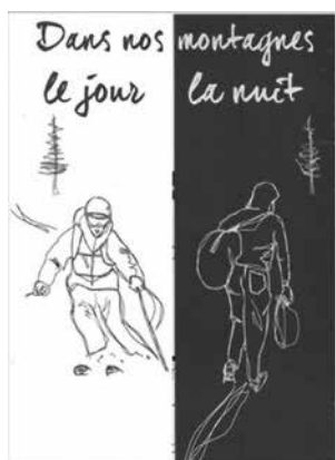
Volantino distribuito ai volontari dell'associazione Tous Migrants di Briançon.

Ciò si può tuttavia legare ad un fenomeno che si osserva non solo ai confini alpini, ma in altre zone caratterizzate da paesaggi naturali potenzialmente pericolosi: deserti, mari, fiumi, montagne. Spazi potenzialmente , ma non intrinsecamente pericolosi. Basta analizzare le pratiche di mobilità di persone in situazione regolare per capire che queste zone attraversate da confini nazionali sono spesso varcate per la mobilità di lavoro quotidiana dai frontalieri, per praticare sport (l'impianto sciistico transfrontaliero "Via lattea" tra la valle di Susa italiana e le Hautes-Alpes francesi), per le crociere mediterranee o per un trekking nel deserto.